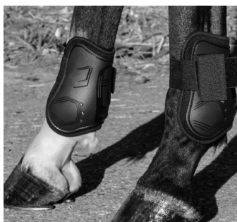
Abb. 22c: Doppelschalengamaschen mit Klettverschluss