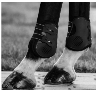
Abb. 22d: Doppelschalengamaschen mit Knopf- oder Hakenverschluss