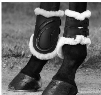
Abb. 22b: Streichkappen mit Knopf- oder Hakenverschluss